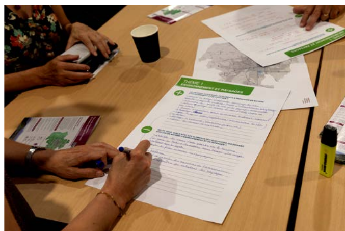
Clermont Auvergne Métropole, photo V,Uta

Une préoccupation particulière a été exprimée relative à la réhabilitation des cours d'eau, notamment ceux enfouis qui méritent d'être valorisés. Mais toutes les autres formes de préservation ou d'introduction de la nature en ville ont été avancées afin d'améliorer le cadre de vie, lutter contre les îlots de chaleur, donner des espaces de respiration, favoriser l'agriculture de proximité et le maraîchage et développer la biodiversité.