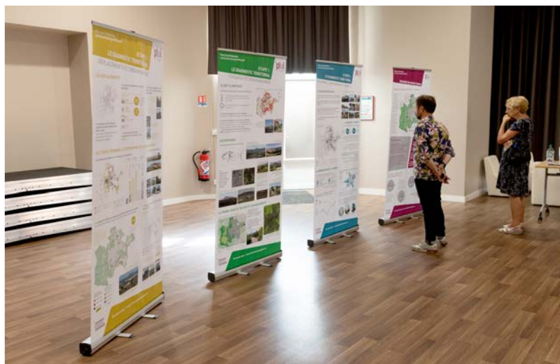
Clermont Auvergne Métropole, photo V,Uta

→ Le support de présentation est présent sur le site de Clermont Auvergne Métropole